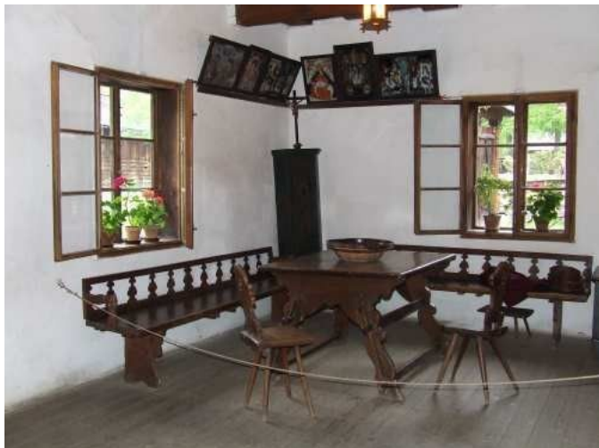
Horní menu - vložit - obrázek - ze souboru ...