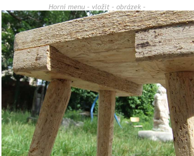
Horní menu - vložit - obrázek -