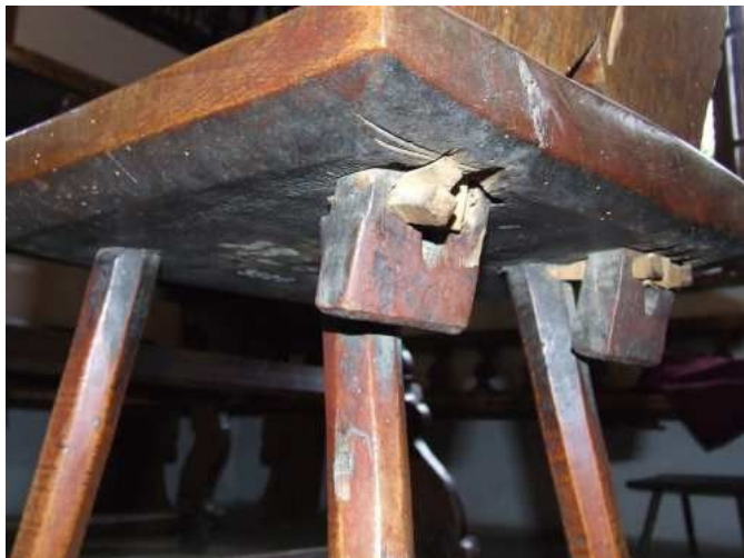
Horní menu - vložit - obrázek - ze souboru ...

název: Konkrétní seskupení kopírovaných objektů