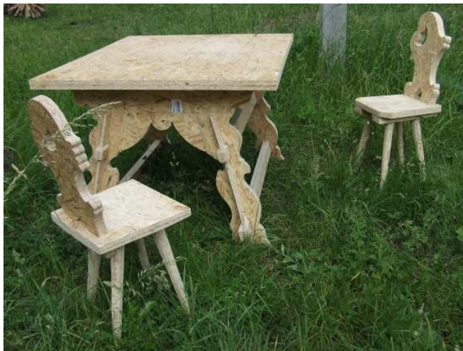
Horní menu - vložit - obrázek - ze souboru ...

název: Předtím a potom materiál/technologie: OSB deska, lepidlo/původní technologie výška x šířka x hloubka v cm: rok vzniku: 2009