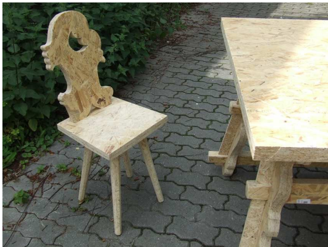
Horní menu - vložit - obrázek - ze souboru ...