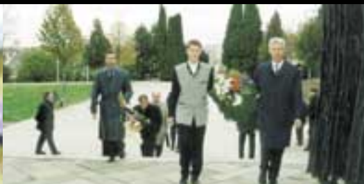
oslava 17. listopadu na VUT v Brně