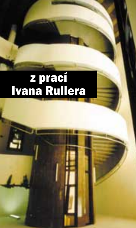
z prací Ivana Rullera