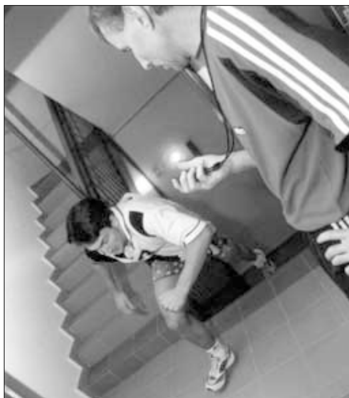
Někteří účastníci dobíhali z posledních sil.