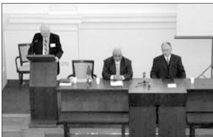
Z jednání konference Nové trendy ve fyzice.