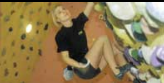
otevření haly nového Boulder centra