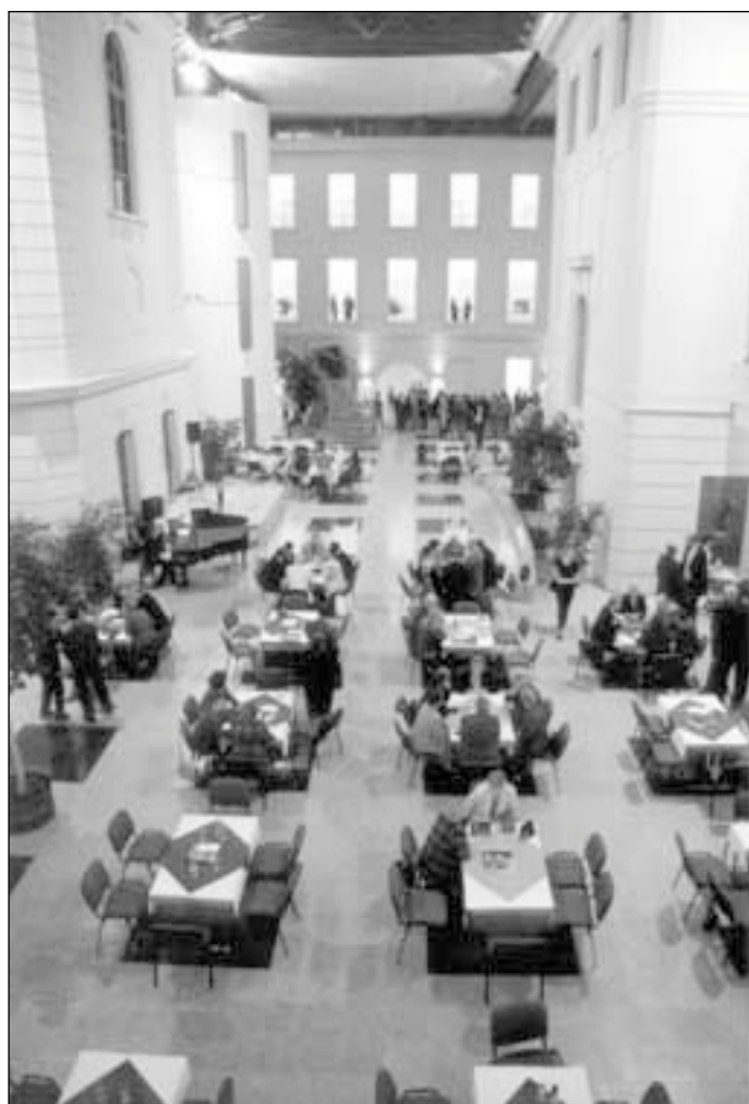
Slavnostní společenský večer u příležitosti zahájení veletrhu Gaudeamus se letos poprvé konal v prostorách Centra VUT v Brně.