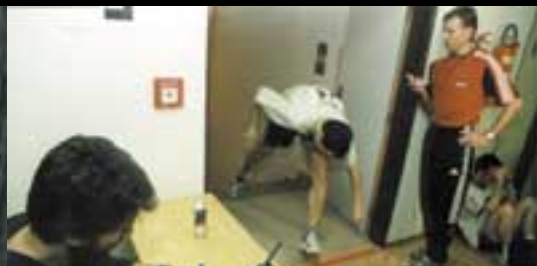
druhý ročník Strojařských schodů