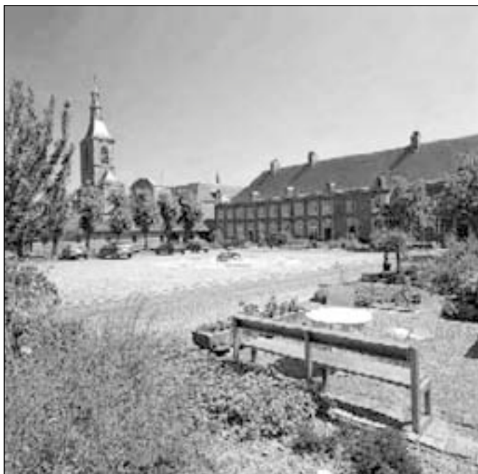
Konference se uskutečnila v Rolduc Kongresovém centru v Kerkrade v krásné historické klášterní budově ze 12. století.

Jednání se uskutečnila v Rolduc Kongresovém centru v Kerkrade, v krásné historické klášterní budově z 12. století. Počet účastníků dosáhl téměř dvou stovek, překvapivě mnoho z nich přijelo z USA a Japonska. Konference byla organizována univerzitními pracovišti v Holandsku (Eindhoven, Nijmegen),