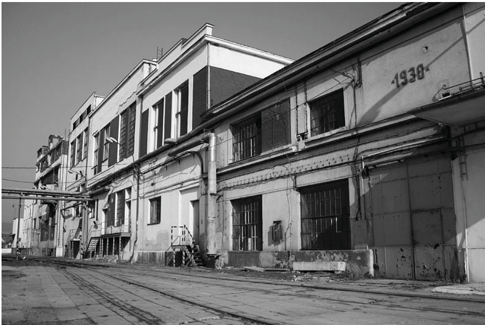
Obrázok 3: Liehovar Old Herold, súčasný stav.

Neskôr v Trenčíne vzniká množstvo ďalších priemyselných objektov najmä v západnej časti a v Zamarovciach, ktoré prispievajú k postupnému hospodárskemu ale aj urbanistickému rastu mesta. Po dokončení oceľových mostov cez rieku Váh sa Trenčín začína rovnomernejšie rozrastať na oboch jej stranách.