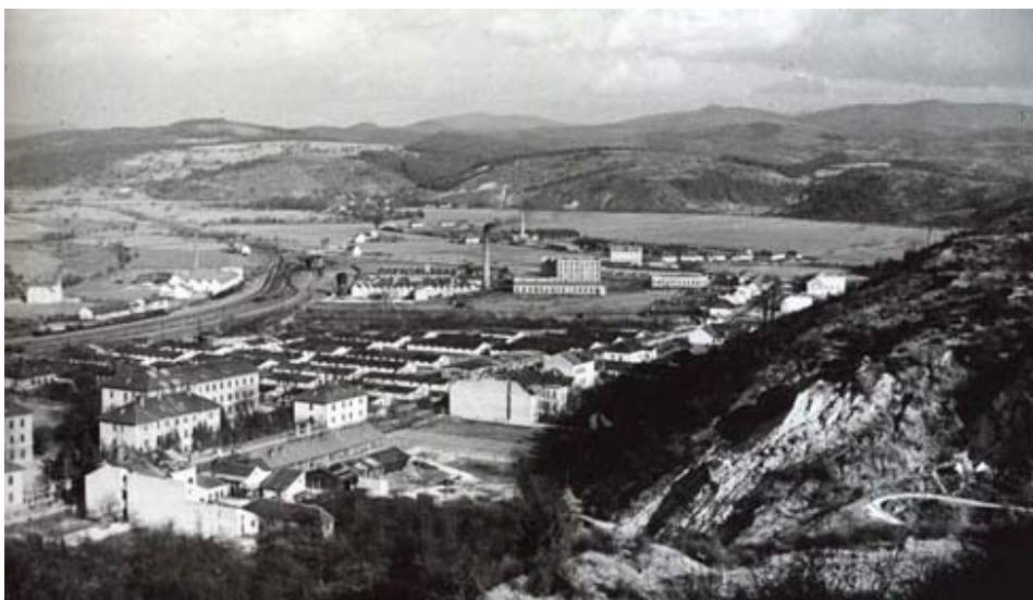
Obrázok 1: Trenčín Pod Sokolice – kasárne + industriálna zóna.

Napriek rozvinutej železničnej sieti, vzhľadom k vojenskému významu mesta, nebol Trenčín vyhľadávaným miestom pre začínajúci priemysel. V roku 1906 sa bratom Tiberghheimovcom podarilo presadiť továreň na spracovanie vlny. Po úspešnom importe francúzskej technológie a skúseností z francúzskeho Tourcoingu, sa následne rozvíja jedna z najúspešnejších tovární v meste. Ešte dnes tu môžeme nájsť obyvateľov s týmto priezviskom.