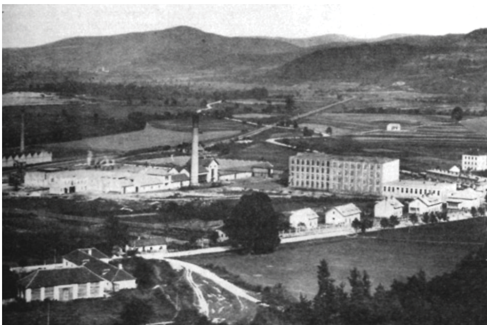
Obrázok 2: Textilná továreň Trenčín, Pod Sokolice. Zdroj: HANUŠIN, Martin. Trenčín na starých fotografiách .

V roku 1905 začala produkcia 1. trencianskej továrne na slivovicu a koňak. Povodne bola umiestnená v tesnej blízkosti centra, neskôr presunutá na druhú stranu rieky. Po začiatku 2. svetovej vojny sa areál rozrastal a dnes pod názvom Old Herold predstavuje výraznú plochu v náväznosti na mestské centrum či nábrežie rieky. Areál vedľa hlavného železničného ťahu, okrem výrobných a skladovacích objektov, obsahoval ubytovacie kapacity pre zamestnancov ako aj administratívne priestory.