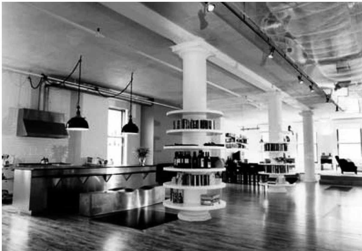
Obr.1, „Loft living“ v bývalých industriálních prostorech v SoHo, NYC. Atraktivita těchto prostor měla za následek proměnu SoHo v živoucí rezidenční čtvrt' s množstvím kaváren, restaurací, galerií a divadel.

přitáhla galerie, obchody restaurace a kluby. SoHo se stalo kulturní čtvrtí a umělci byli vytlačeni neúnosně se zvyšujícími se nájmy a vystřídáni bohatšími nájemníky. Podobný proces už v minulosti v New Yorku proběhl například East Village i jiných čtvrtích. V současnosti lze najít podobné náznaky v Harlemu – původně černošské čtvrti se zvýšenou kriminalitou, která je dnes vyhledávána pro svou živelnost a kde má dnes rezidenci např. Bill Clinton.