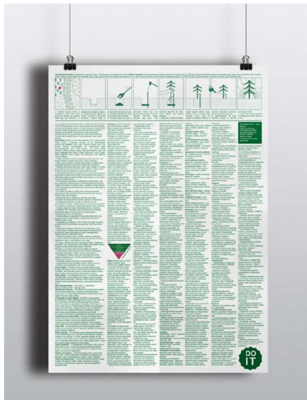
Propagačný plagát zadná strana, risograf, recyklovaný papír, 297x420 mm, 2017