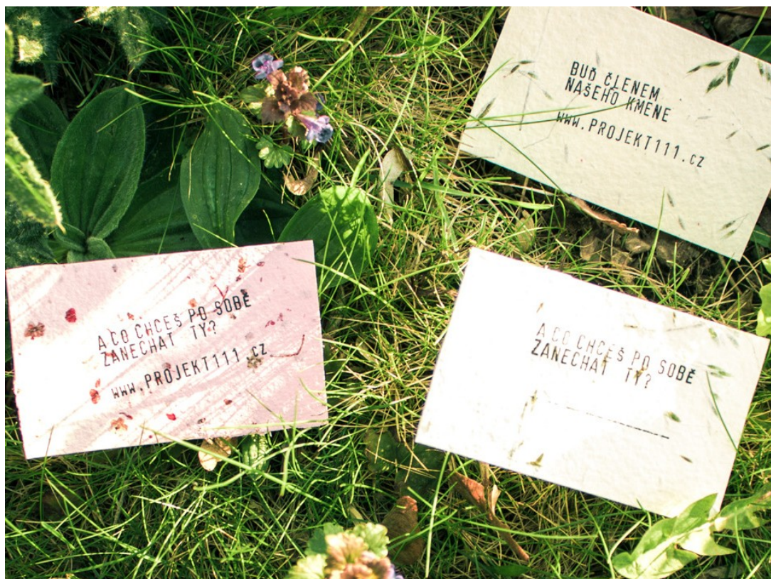
Vizitky, ruční papír so zalisovanými rastlinami a semienkami, razítko, 2017