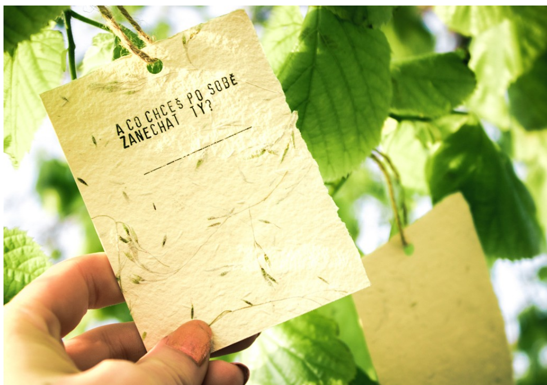
Guerilla kampaň “Strom nádeje” – razítko, ručný papier, semená lokálnych rastlín, 2017