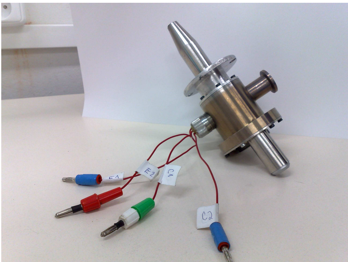
Obr.1 Ukázka demontovaného scintilačního detektoru na ÚPT AV ČR v Brně.