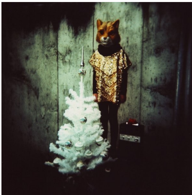
název: Tajný les rozsah (délka trvání, počet zúčastněných): Fragment z akce Tajný les/ 7 měsíců popis akce (další údaje dle potřeby): Zhotovení grafické koláže v období akce Tajný les rok vzniku či další časové údaje: 2009