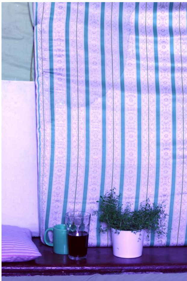
Petra, tisk na hedvábí, 69x46, 2012