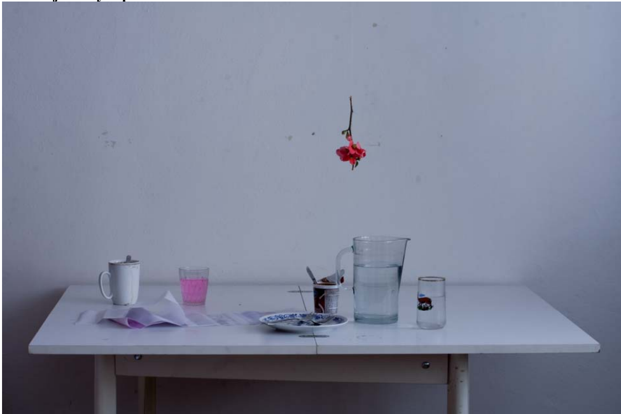
AnEt, tisk na hedvábí, 46x69, 2012

K obhajobě bylo předloženo 6 obrazů – tisk na hedvábí.