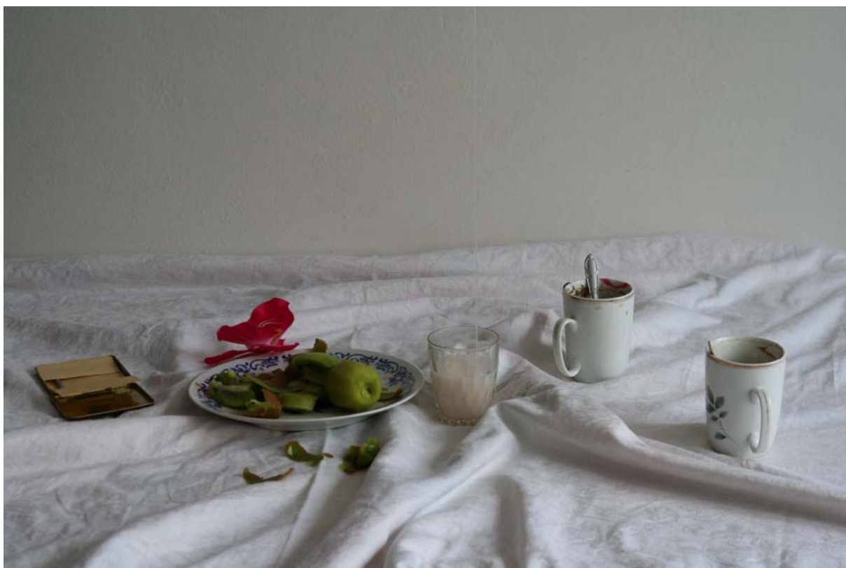
Milan, tisk na hedvábí, 46x69, 2012