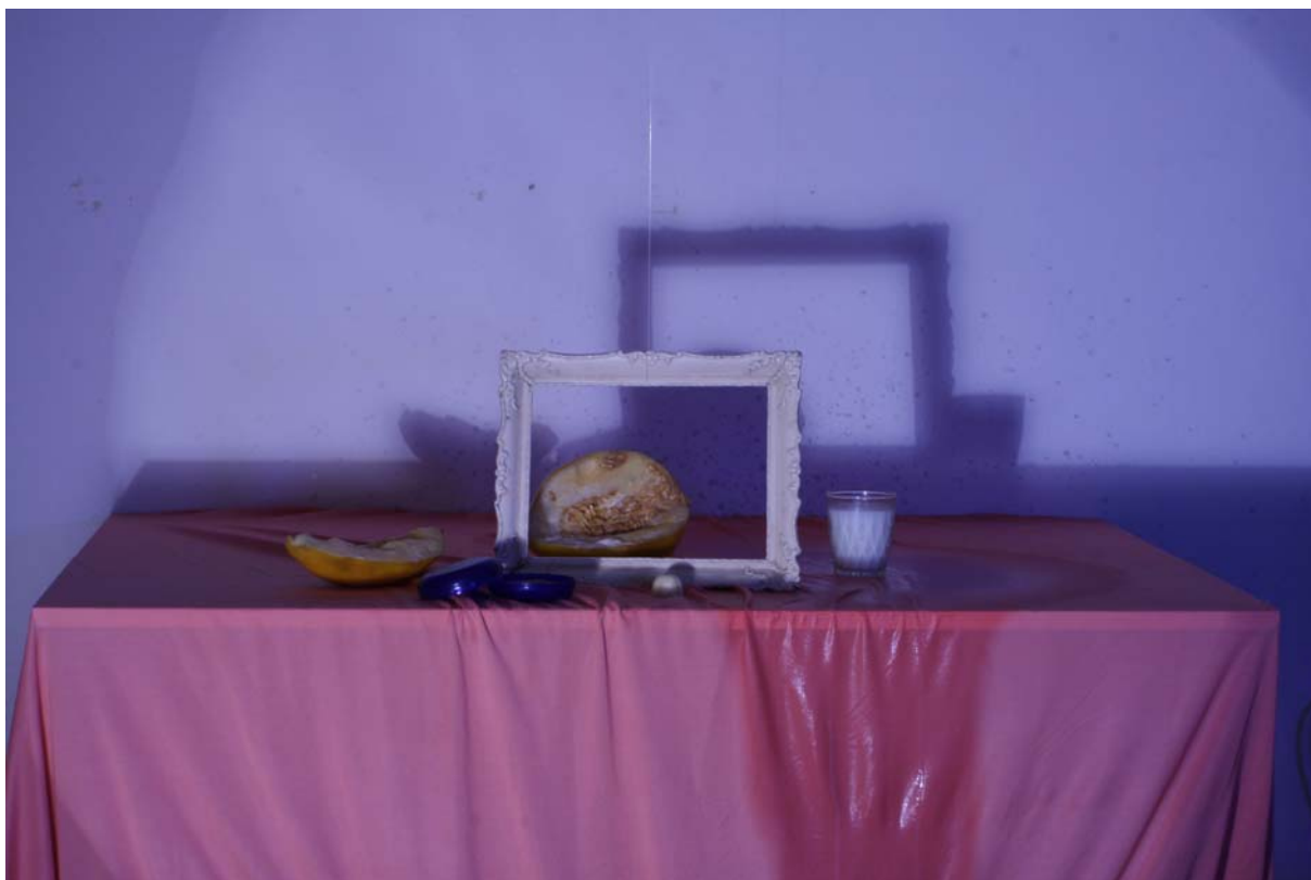
Eduard, tisk na hedvábí, 46x69, 2012