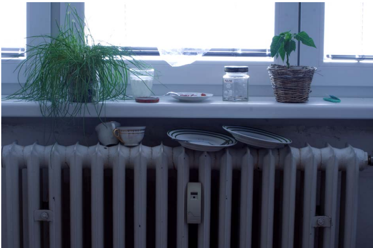
Ivan, tisk na hedvábí, 46x69, 2012