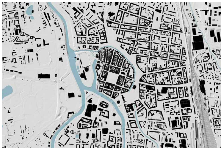
Obr. 3. České Budějovice - historické město je jasně odděleno vodou a stopou bastionů od novější zástavy, která se rozvíjela především směrem k nádraží