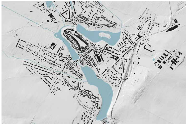
Obr. 1. Telč - hradby a rybníky jako součást fortifikace města jasně vymezují historické jádro. Dobře patrná je i struktura historických předměstí doplněná moderní rozvolněnou zástavbou. Dosud nepřekročenou novodobou hranici města tvoří železnice.

Opevnění měst hrálo klíčovou roli ve vývoji urbanismu až do 19. století. Jisté omezení výstavby, které hradby způsobily, bylo katalyzátorem kvalitativního rozvoje a zahusťování měst uvnitř hradeb. V současné době tvoří podobné bariéry převážně dopravní stavby, jejich účinek na urbanismus je ale veskrze negativní a vede naopak k degradaci prostředí a ředění měst. Principy spojené s pevnou hranicí měst by mohly být do budoucna nástrojem iniciace rozvoje problematických míst ve městě. Především díky změně ekonomicko-právních pravidel platících uvnitř ohrazených území.