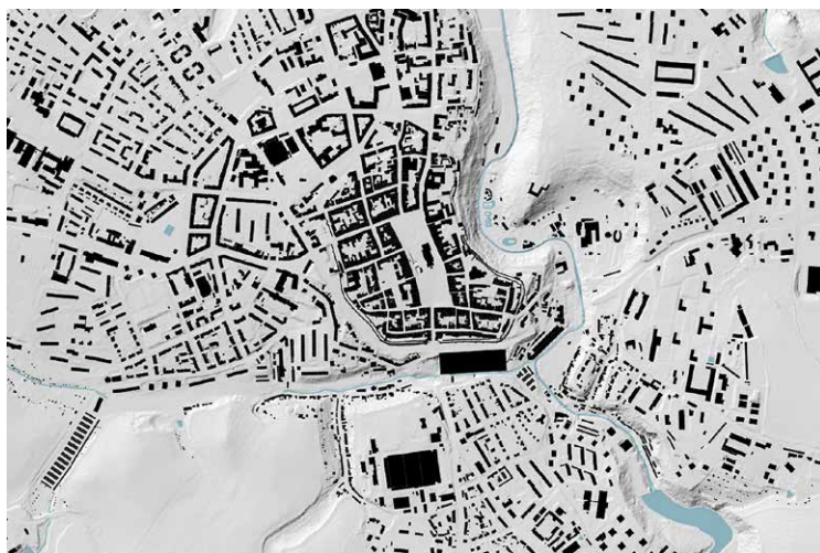
Obr. 2. Jihlava - ideální příklad vztahu opevnění a urbanistické struktury – dodnes stojící středověké hradby vymezují historické jádro, předměstská zástavba odráží průběh dnes již zaniklých bastionů