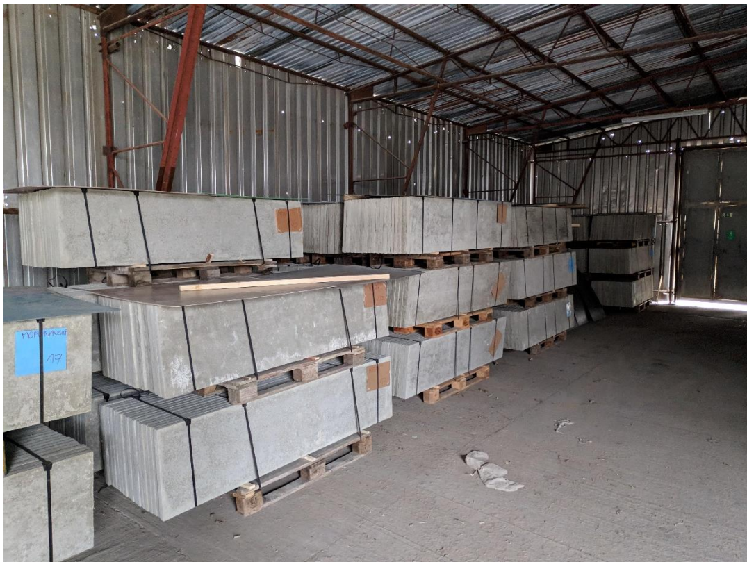
Obrázek 3 Sklad hotové výroby, výrobky čekají na distribuci