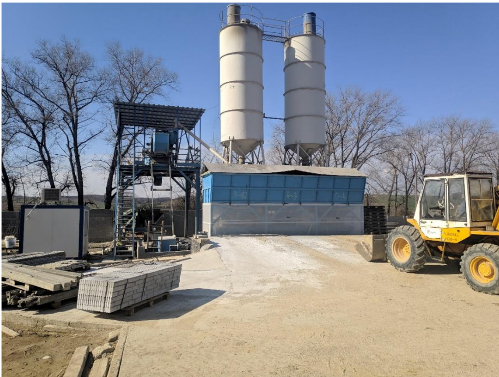
Obrázek 1 Betonárna, manipulátor JCB