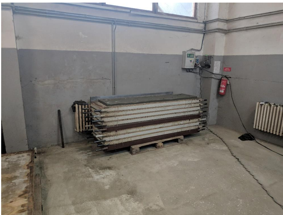
Obrázek 2 Odlitek desky vyklopen na máry, sklad A