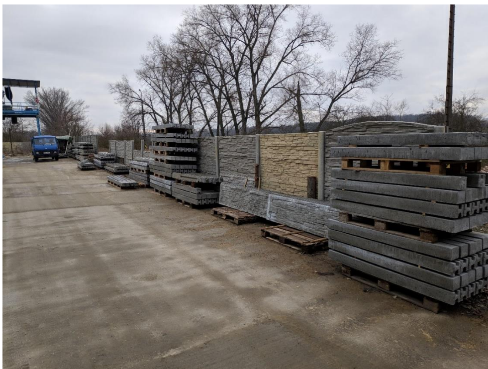
Obrázek 4 Skladování zásoby sloupků ve volných prostorách areálu