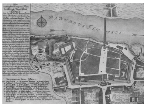
Obrázek 3: Plán města Linze z roku 1710. Obrázek 4: Dominantní prvek prostoru dnešního hlavního náměstí v Linzi.

Hlavní město spolkové země Horní Rakousko má výhodou polohu na říční křižovatce, která je datována již z keltské doby. V roce 1409 získalo město status provinciální metropole, protože si jej císař vybral za své sídelní město. Koncem 15. století po dobytí Vídně se Linz stal středem Svaté Říše Římské. Důležitým mezníkem v rozvoji města byl rok 1497, kdy byl postaven kamenný most přes řeku Dunaj. To umožnilo další rozkvět řemesel a obchodu.