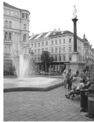
Obrázek 2: Hauptplatz v Grazu. Obrázek 3: Platz am Eiseners Tor.