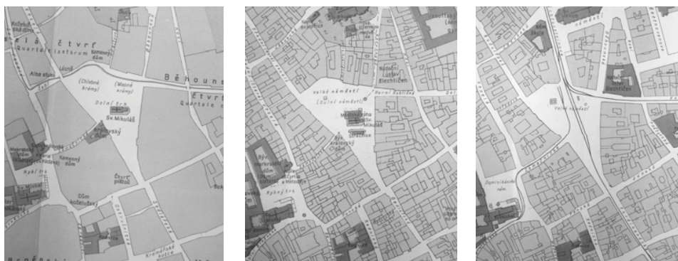
Obrázek 1: Náměstí Svobody v roce (zleva) 1400, 1749 a 1914.

západní strana náměstí) a vedením městského potoka (severní strana), který byl později zasypan. Stopa domů však již takto zůstala. Tvář náměstí se razantně změnila koncem 19. století odstraněním původního gotického kostela sv. Mikuláše a barokní budovy městské váhy. Celý soubor budov byl postaven příčně v prostoru dle orientace kostela směrem západ-východ a pomyslně rozdělil plochu náměstí na menší segmenty situované při ústí hlavních ulic. Odstraněním kostela sv. Mikuláše přišlo náměstí o významný kus historie a dominantu náměstí. V těžišti prostoru před nástupem do ulice České zůstal dodnes zachován současný akcent náměstí – morový sloup. Na přelomu 19. a 20. století byla asanována řada významných budov obklopujících prostor náměstí. Zástavba v centrální části města tak ve většině případů pochází z let 1904-1914. Součástí prostoru náměstí byly i prvky a plochy zeleně, a to výsadba vzrostlých stromů kolem budovy strážnice a parčík při ústí Masarykovy ulice. Jejich funkce však byla ryze praktická a k atraktivitě náměstí příliš nepřispěla. V roce 2006 proběhla poslední novodobá rekonstrukce náměstí. V celém prostoru došlo k výměně dlažďeného povrchu a přibylly nové prvky: kašna (v místě, kde historicky původní kašna stávala) pítko, stromy a městský mobiliář. Historická stopa kostela sv. Mikuláše byla ztvárněna kovovou linkou kopírující půdorys kostela v místech, kde dříve stával. Od roku 2011 je součástí náměstí také „Brněnský orloj“.