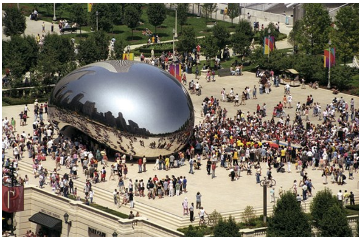
3. Anish Kapoor, Cloud Gate, Millennium Park, Chicago, 2004; zdroj: http://www.anishkapoor.com/works/public/2004cloudgate/index.htm

KWON, Miwon. One Place after Another: Site-Specific Art and Locational Identity . 1. vyd. Cambridge, Mass.; London : MIT Press, 2004. 230 s. ISBN 978-0262612029.