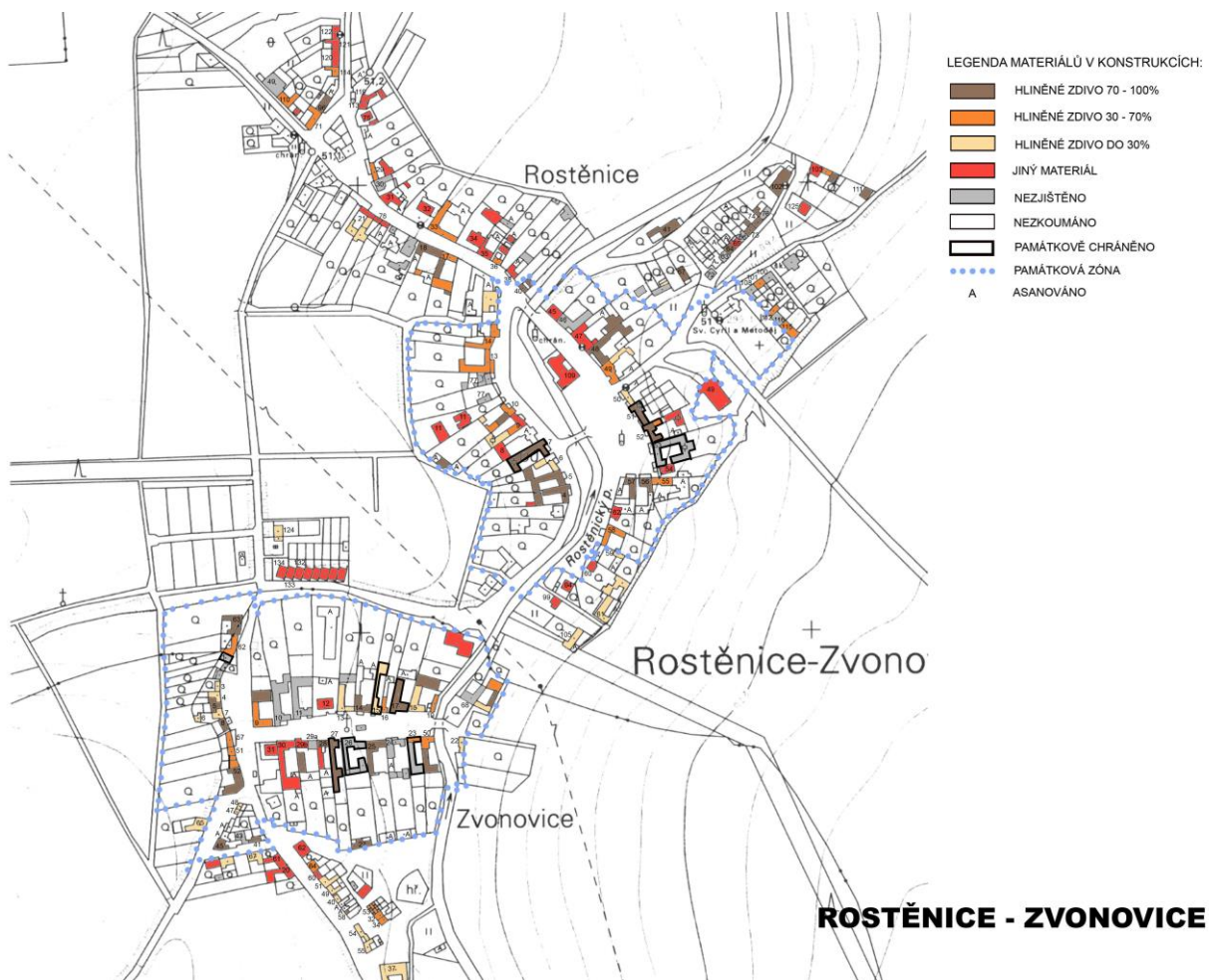
7 Obr. 1 Mapa zastoupení stavebních materiálů v obci Rostěnice-Zvonovice